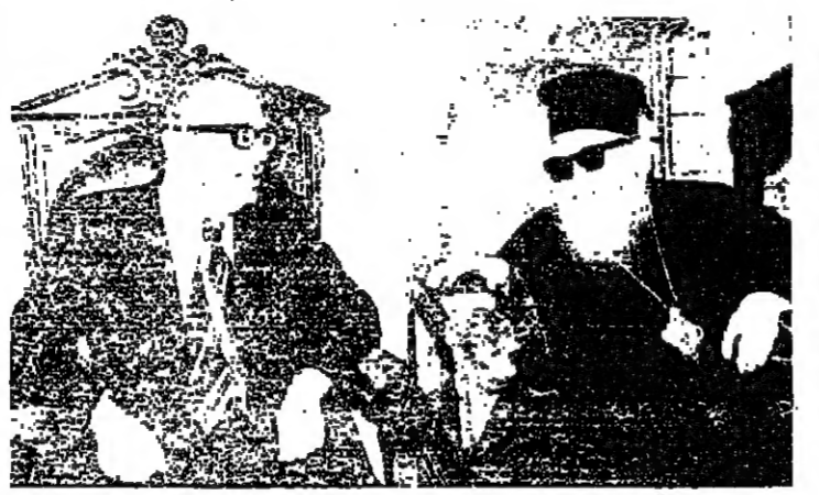
سيادة القروبوليت ايليا الصليبي والمصالح